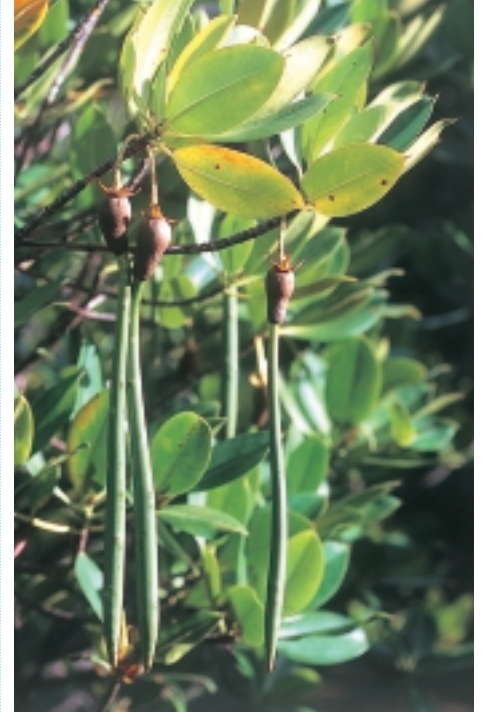
Mangrovezaden vind je in velerlei vormen. Ze drijven veelal goed en kiemen bij nogal wat soorten reeds aan de moederboom. Hier zaden van Rhizophora (MD)