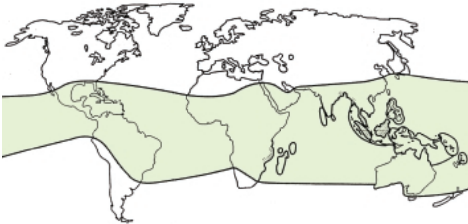
Mangrovebossen houden niet van vorst. Ze komen voor aan beschutte kusten tussen de dertigste breedtegraad ten noorden en zuiden van de evenaar, waar de gemiddelde minimum temperatuur nooit zakt onder ca. 20°C (VL)