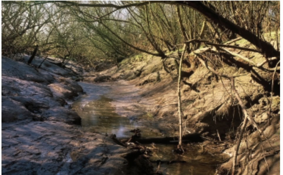
De (sub)tropische mangroves (rechts) en de wilgevoedbossen uit gematigde streken (boven) vertonen meer dan alleen maar oppervlakkige gelijkenissen (resp. YA en JS)

Om het hoofd te bieden aan de vaak slibrijke, papperige en zuurstofarme bodems waarin ze groeien, hebben nogal wat soorten luchtwortels ontwikkeld. Deze 'pneumatoforen', ook wel ademwortels genoemd, geven de mangrove niet alleen de nodige steun. Ze kruipen als het