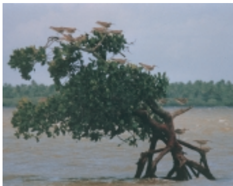
Voor ornithologen met ervaring in West-Europa blijft het zicht van groepen Regenwulpen die overtijen in mangrovestruiken een zeer ongewone aanblik (JS)