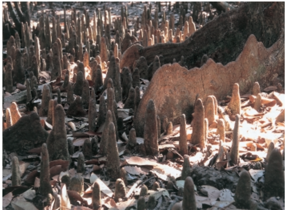
De luchtwortels van mangroves (linksboven: Avicennia , linksonder: Rhizophora ; rechts: o.a. Xylocarpus ) geven de bomen niet alleen extra steun op de papperige bodems waarop ze groeien, ze laten de boom ook toe bij elk getij ook nog voldoende zuurstof op te nemen (resp. NK, NK en MD)

dit milieu. En misschien wel de meest merkwuurlijke aanpassing is de 'levendbarende' voortplanting die ze in petto hebben. Zaden slaan bij meerdere soorten de rust-fase over en kiemen reeds aan de ouderboom. Handig als je niet weet waar je terecht komt bij de val van de moederboom. Bij laagwater kan het zaad zich zo immers heel snel verankeren in de losse bodem. En is het hoogwater, dan zorgt het drijfvermogen van de zaden voor verdere verspreiding.