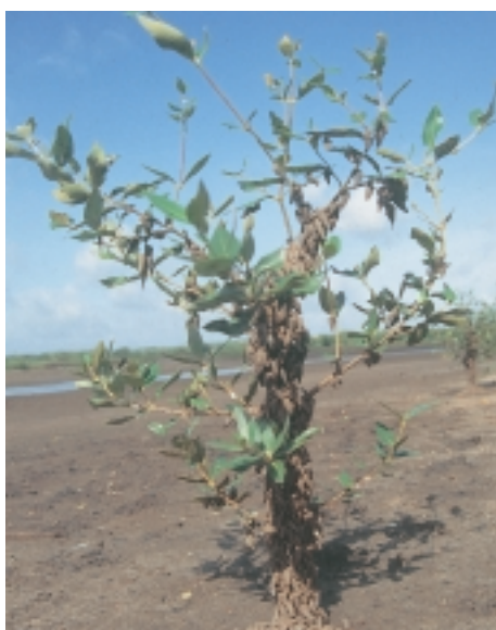
Alleen al in de tweede helft van de 20 ste eeuw werd wereldwijd ca. 50% van alle mangrovebestanden gekapt, en jaarlijks verdwijnt nog eens 2,5% veelal zonder dat er heraanplanting plaats grijpt (JS)