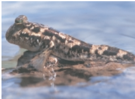
De Slijkspringer is zowat de verpersoonlijking van de evolutionaire overgang van vissen naar amfibieën (MD)