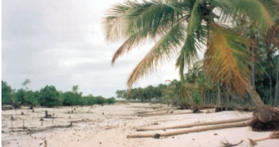
Mangroves vormen een levende dijk tegen de aanvallen van de zee. Worden ze verwijderd, dan staat niets nog de verdere aantasting van de kustlijn in de weg, zoals hier geïllustreerd t.h.v. een kokosplantage te Gazi (Kenia)(JK)