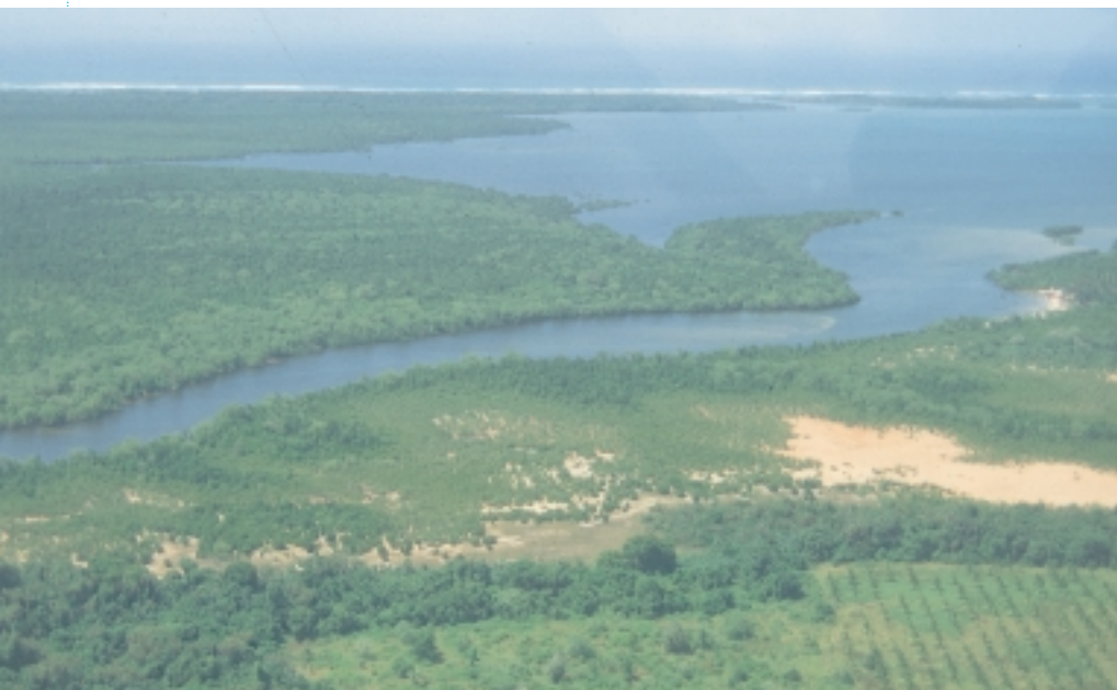
De tropische baai van Gazi (Kenia) was gedurende vele jaren het werkterrein van een interdisciplinair en internationaal team wetenschappers waaronder heel wat Belgen