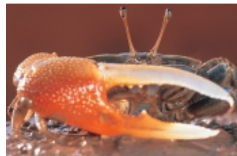
In mangroveland zwaaien krabben de scepter