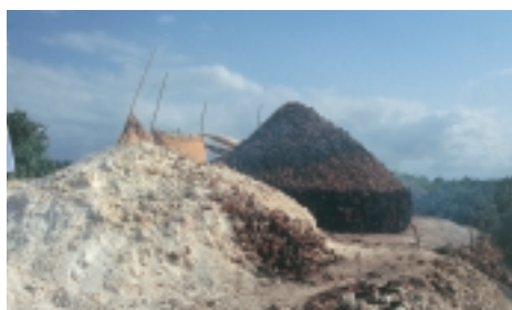
Mangrovebossen zijn het échte kapitaal van de lokale kustgemeenschappen (boven). Het hout wordt o.a. gebruikt bij de bouw van huizen (rechtsonder) en als brandstof bij de aanmaak van kalk uit fossiel koraal (linksonder)