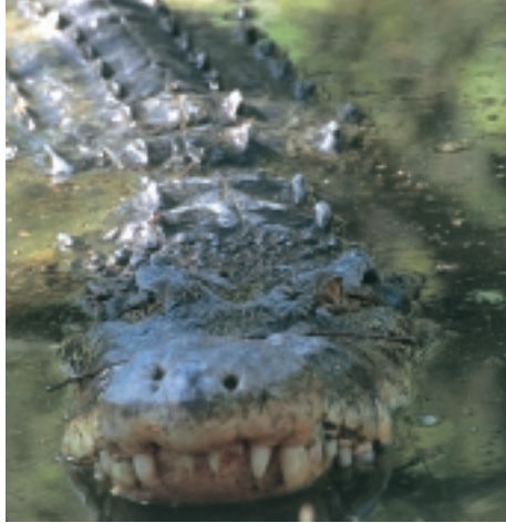
A close encounter of a vicious kind... Een zeekrokodil in een Indiaans mangrovegebied (MD)

Alleen al in de tweede helft van de 20 ste eeuw werd wereldwijd ca. 50% van alle mangrovebestanden gekapt. En jaarlijks verdwijnt nog eens 2,5% zonder dat ernstige heraanplantingsacties daar tegenover worden geplaatst! Daarbij moeten mangroves plaats ruimen voor suikerrietplantages, rijstvelden, zoutwinnertuinen, aquacultuur, uitbreiding van dorpen, toeristische infrastructuur of worden ze geslachttofferd aan olieafvalverwijdering of ingrepen in de waterhuishouding van de streek. Zo verdwenen tienduizenden hectare 'waardeloze' mangrove om plaats te bieden aan de intensieve garnalenkweek. Helaas blijft na verloop van tijd – ten gevolge van een niet-duurzaam beheer van deze kweekvelden – vaak niets meer over dan troosteloos braakland, waar ook de mangrove niet meer gedijt. Cynisch genoeg hebben deze garnalenfarms voor de kweek eierdragende wijfjesgarnalen nodig die in open zee worden gevangen ... en om te overleven afhankelijk zijn van diezelfde mangroves. Onderzoekers aan de Universiteit van Stockholm berekenden in dit verband dat tientallen keer de oppervlakte aan mangroves nodig is t.o.v. het areaal aan garnalenkweekvelden.