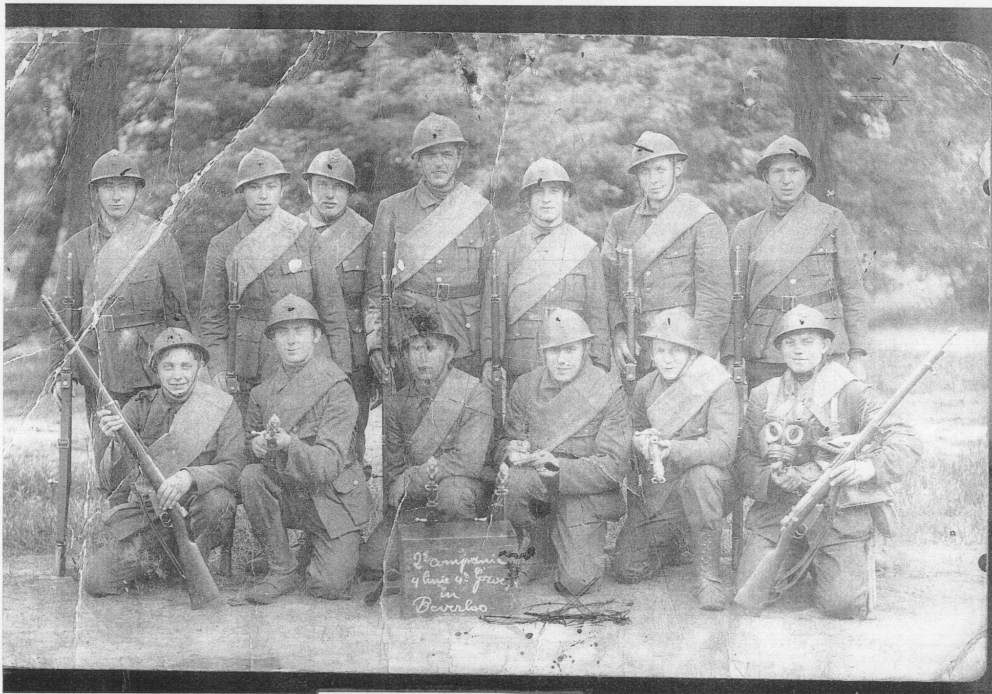
(L) Groepsfoto van de 2 de Compagnie.