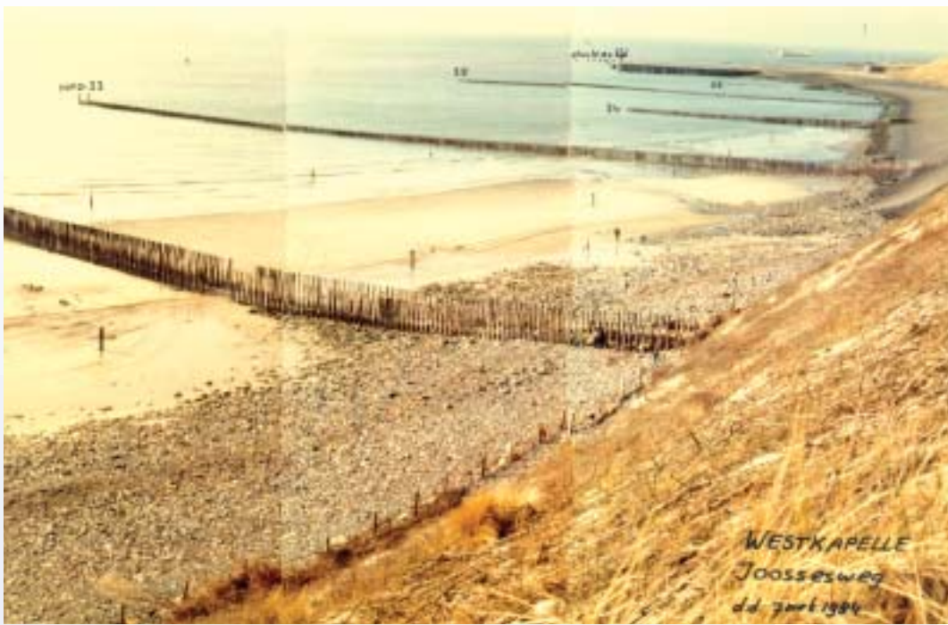
Deze oude collage laat nog steeds het beste zien hoe het kustbeleid is verbeterd: Het kustvak bij Westkapelle voor de invoering van het suppletiebeleid (boven) en na invoering suppletiebeleid: kwaliteitsverbetering voor veiligheid en recreatie.