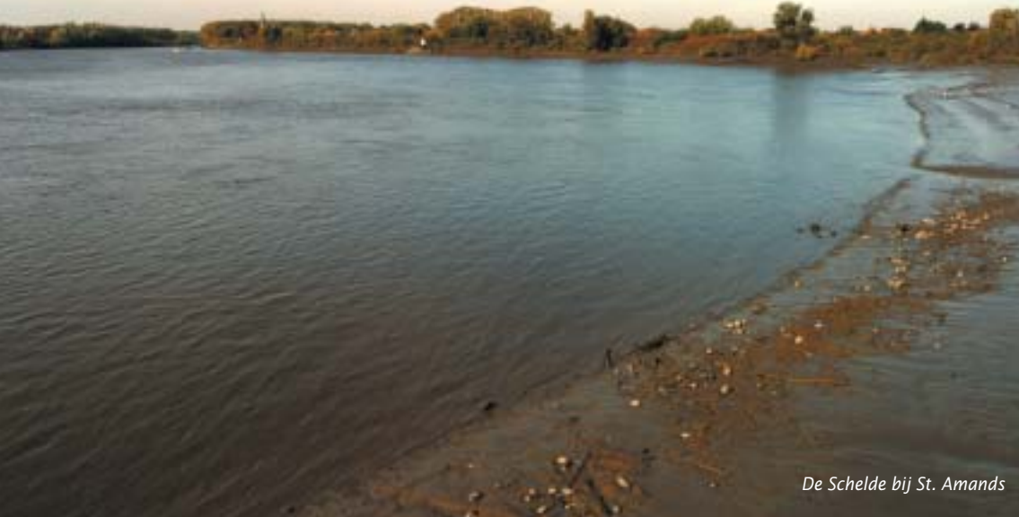
De Schelde bij St. Amands

De oeverstaten langs de Schelde hebben elkaar gevonden in het proefproject Scaldit. Dit Europese project vloeit voort uit de Europese Kaderrichtlijn Water (KRW) en moet uitmonden in één gezamenlijk beheersplan voor de Schelde. De Schelde Nieuwsbrief sprak hierover met twee projectmedewerkers en informeerde naar invulling van communicatie en burgerparticipatie.