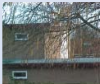
Bitumen dakbedekking vervuilt grond- en oppervlaktewater

Het klinkt mooi, maar waarom is dit zo belangrijk? Welnu, legt Loes uit, de vraag naar water van goede kwaliteit neemt toe, bijvoorbeeld voor drinkwaterproductie of voor een leefbare omgeving, voor vispopulaties en waterrecreatie. Ook de ruimte voor water is van